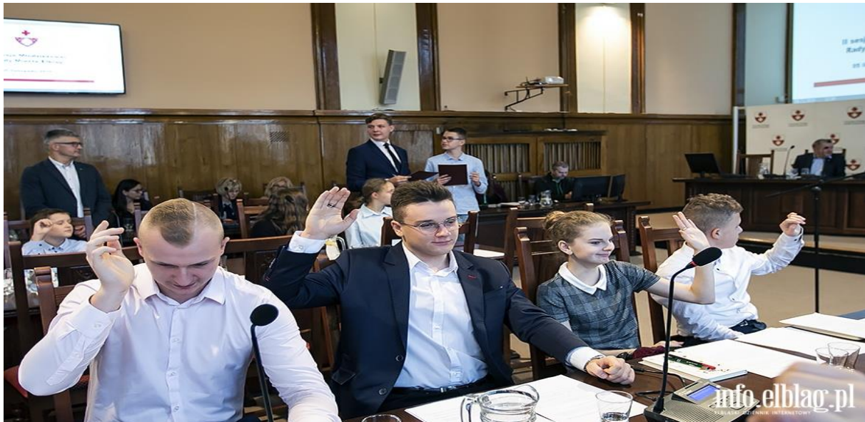
Fot. 2. Głosowanie MRM.