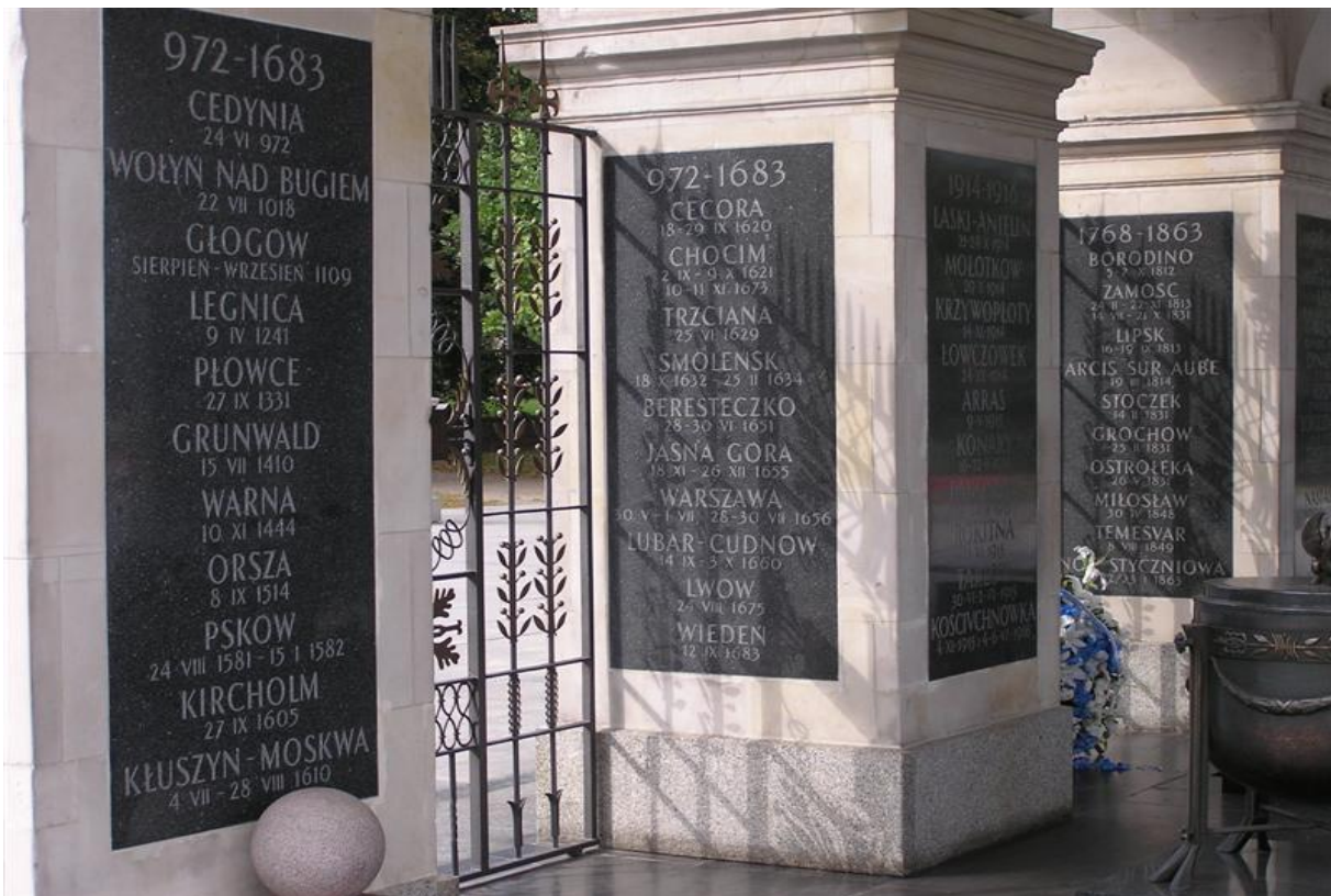
Fot. 1. Tablice na Grobie Nieznanego Żołnierza w Warszawie. Źródło: www.bing.com/images [data pobrania: 10.10.2020].