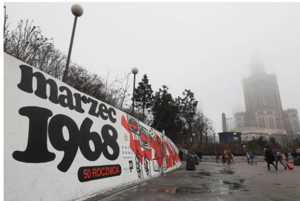
www.bing.com/images/mural „Marzec ’68”

Źródło 4. do zadania 20. Mural „Marzec ’68”.